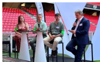
Table ronde des coups de coeur du Comité à l'ADN Festival 2023 =>, le Trophée du numérique de l'ouest catégorie Solidarité, remporté par Dessine-moi la High Tech.

Séminaire inclusion et équité dans les métiers du numérique organisé avec ADN Numérique Responsable d'ADN Ouest : de l'orientation, en passant par le recrutement, l'intégration, l'exercice du métier, sans oublier la reconversion, l'occasion de challenger les barrières et les freins, et ouvrir le champs des possibles grâce à différents REX concrets.